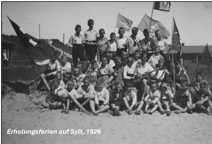
Erholungsferien auf Sylt, 1926

Im Ersten Weltkrieg und in den Krisen- und Kriegsjahren bis 1950 festigte der Verein seine enge Kooperation mit dem Staat und blieb vom Wechsel der politischen Verhältnisse insoweit unberührt, als dass er nahezu permanent im Krisenmodus für bedürftige Schulkinder und sogar andere Zielgruppen arbeitete, egal, welche Administration ihn beauftragte und finanzierte. Zwischen 1920 und 1925 führte er die Schulspeisung durch, die durch Spenden der Quäker und später auch anderer Organisationen aus den USA ermöglicht wurde. In den wirtschaftlichen Krisenjahren ab 1930 weitete der Verein die Mittagsspeisung für bedürftige Schulkinder, aber auch Rentner und Arbeitslose erheblich aus. Das Schulfrühstück musste er hingegen nach den Sommerferien 1931 einstellen, weil es die Stadt nicht mehr finanzieren konnte. Der Betrieb der Erholungsheime, der in den Kriegs- und Nachkriegsjahren fortgeführt und sogar ausgebaut wurde, erlitt einen Einbruch, als sich die Stadt in der Wirtschaftskrise aus der Finanzierung zurückziehen musste.